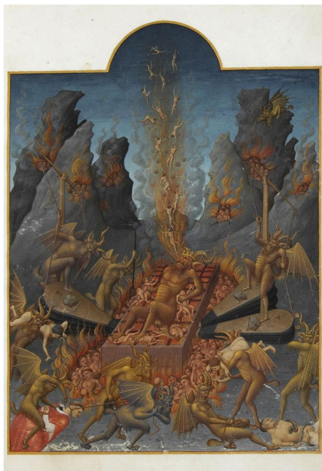
Figura 2. Inferno. Les Tres Riches Heures du Duc de Berry (Livro de Horas do Duque de Berry), 1415. Musée Condé (ms. 65/1284, fol. 108r), Chantilly.

A ssua figura era esta. S. El era negro assi como caruon e auia figura dhomen dê s os pees ataa cabeça . E auia boca em que auia muitos males e tynha huun rabo assy grande que era cousa muito spantauil. No qual rabo auia mil maaons. E em cada maaon auia em ancho cem palmos e as suas maaons e as hunhas delas e as hunhas dos pees eram tam anchas como lanças e todo aquel rabo era cheo de agulhas muy agudas pêra atormentar as almas. (VT, 1985:110). (grifos nossos).