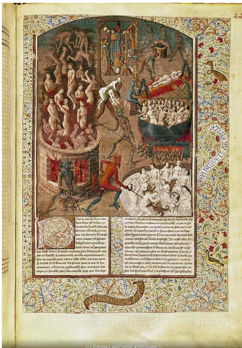
Figura 1. Santo Agostinho. A Cidade de Deus. (Imagem do Inferno), MS 246 fol.383 France, século XV. Inferno. Bibliotheque St. Genieve, Paris.

códice 244 da visão: “E estes diaboos tynham em suas mãos ganhos de ferro muyto agudos e outros aparelhamentos . Com que enpesauan as almas. E dauan com ellas dentro no fogo [...]” (VT, 1895:103) (grifo nosso).