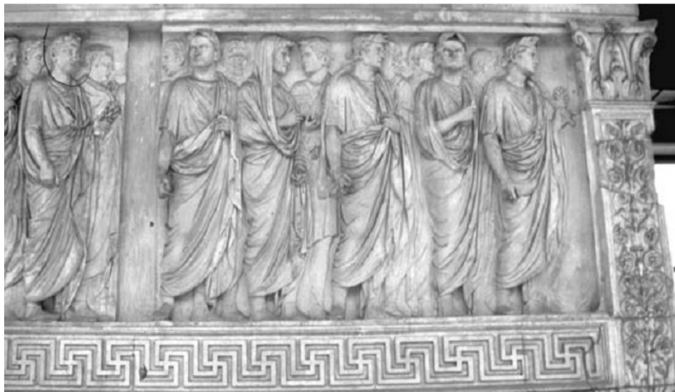
Imagem 2 – Ara pacis , Painel superior norte, primeiro grupo da procissão de magistrados (REHAK, 2006: 252)

A procissão configura imageticamente a classe política romana em concordia ordinum , ou seja, sem disputas e rivalidades, pois está sob a liderança de Augusto. A procissão não representa necessariamente a celebração inaugural do altar e não tinha por finalidade figurar um evento histórico específico, era teórica, uma reditus idealizada, que tinha como função, na comunicação política, de reafirmar a hierarquia da sociedade imperial romana para o público.