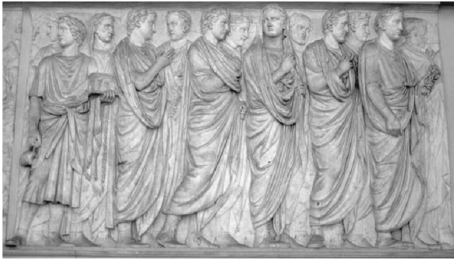
Imagem 1 – Ara pacis , Painel superior norte, segundo grupo da procissão de magistrados (KEHAK, 2006: 253).