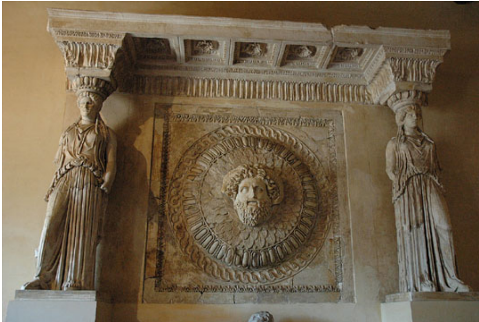
Imagem 4 - Fórum de Augusto, parte superior dos pórticos, detalhe das cariátides flanqueando um escudo com a cabeça de Júpiter Ammon ( https://resources.oncourse.iu.edu/access/content/user/leach/www/2006/caryatid1.jpg

e do fomento ao comércio. Em 12 a.C., o Pontifex maximus realizou o ato de purificação do lustrum , uma purgação das energias negativas da cidade (PETTT, 1974: 26). Em 18, Augusto celebrou os Jogos seculares ( Iudi saeculares ) cuja finalidade era demarcar a renovação do mundo na tradição etrusca, houve competições, sacrifícios, jogos, performances teatrais e exposição de animais exóticos.