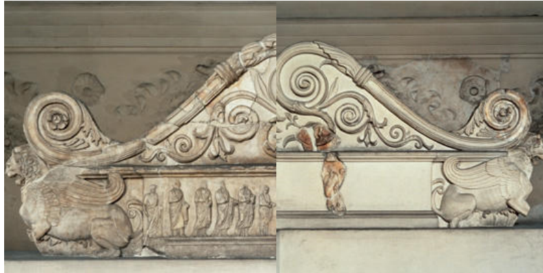
Imagem 5 - Ara pacis, decoração animal dos frisos.

A ideia de um novo tempo para Roma veio acompanhada com o reforço da identidade de Roma como Senhora do mundo. Roma era encarregada pelos deuses de não só dominar toda a oikouménē , o mundo habitado, mas também organizá-lo. É difícil traçarmos quando esta ideia de mandato divino de Roma teve início. O processo parece ter tido suas raízes nos círculos aristocráticos imbuídos de estoicismo da época de Cipião Emiliano, que considerava como missão histórica de Roma lograr a unificação política da comunidade de homens “racionais”, com a qual justificava a sua política de conquista. Os chefes militares seguintes continuaram esta política (Sila, Pompeu e César).