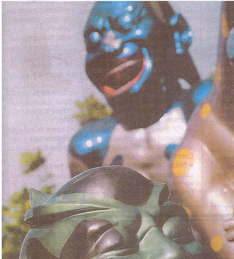
Godzillas - Projeto colourfull running dinosaurs Bienal de Xangai-2008

De todo modo, não haveria aqui a apresentação de um paradigma que temos denominado estético-expressivo? Que não se satisfaz com o exercício exclusivo da razão e dos métodos experimentais, com o recurso da dedução/ indução, mas se desdobra na questão do imaginário, onde a abdução tem um papel metodológico fundamental. Poderíamos chamá-lo de método clínico? Sim, porque inclui o pathos como questão a ser considerada. Até mesmo na tradição confrontada desde Platão, Aristóteles, Tucídides. Onde história, retórica e prova se entrelaçam e não se excluem. Nesse caso ethos e pathos vinculam-se entre si como, aliás, Jacques Lacan já prenunciava na tríade RSI (Real, Simbólico, imaginário)?