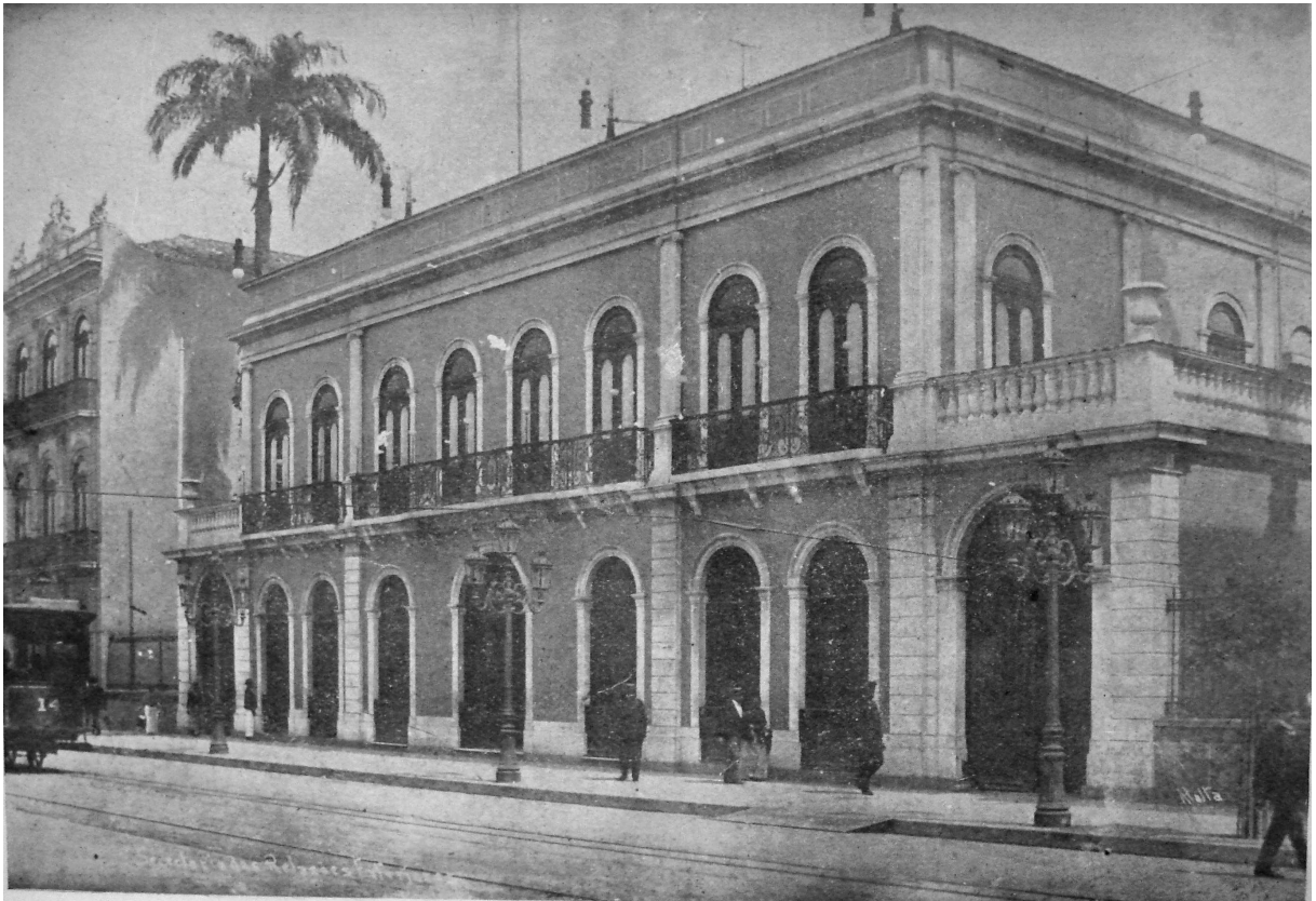
Fig.3 Imagem do Palácio do Itamaraty, sede do Ministério das Relações Exteriores do Brasil, no início do século XX nnn