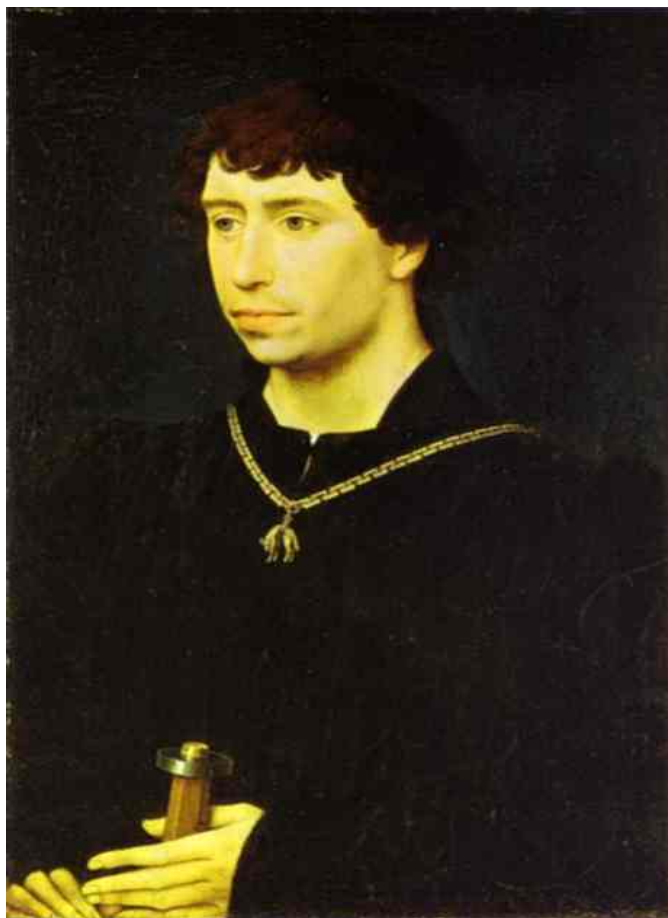
Figura 6- Retrato de Carlos da Borgonha (Ateliê de Roger Van der Weyden). Óleo sobre tela. c. 1460. Gemaldegalerie, Berlim. O último duque da linhagem foi visto por longo tempo sob uma luz desfavorável por historiadores e ficcionistas, que destacavam seu fim trágico como resultado de uma temeridade que beirava a loucura. Carlos visto por La Marche é um modelo, vítima da vontade divina de mostrar que o destino é incerto, por isso teve uma morte indigna de sua qualidade. O retrato representa o futuro “Temerário”, apelido dado pelos franceses, enquanto conde de Charolais. Usa o preto da corte e o colar da ordem, ainda como cavaleiro. Ao assumir o ducado e a ordem, passaria a usar o colar de Felipe, que apareceu na figura anterior.