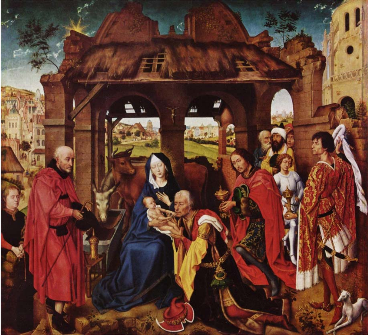
Figura 4 - Adoração dos Reis Magos (Roger Van der Weyden) Óleo sobre tela. c. 1455-60 Grande Pinacoteca, Munique. Pelas demais representações deixadas dos duques da Borgonha, é tido como certo que o rei-mago ajoelhado em adoração é Felipe, o Bom, enquanto que seu filho, Carlos, está em pé na extrema direita. Foi pintada a mando de um doador, que está representado na extrema esquerda, ajoelhado. Pai e filho aparecem aqui despidos de seus trajes escuros e sóbrios, típicos de seus retratos como duques da Borgonha. Nesta pintura, são representados como reis orientais, portadores de riquezas e sabedorias. Participam como atores de uma cena sagrada, algo incomum nas pinturas flamengas da época, mas que tem paralelos na Península Itálica, onde Van der Weyden passou uma temporada.