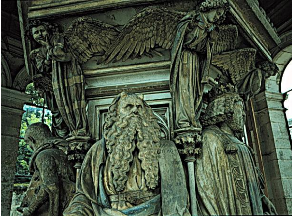
Figura 2 – Detalhe do Poço de Moisés obra em granito de Claus Sluter. Convento de Champmol, c. 1390. Claus Sluter foi um destacado escultor do fim do século XIV, e tornou-se responsável pelos dois maiores empreendimentos do duque Felipe, O Audaz, em relação às artes: o convento de Champmol, destinado a ser o último repouso do duque em meio a monges da ordem dos Cartuchos; e a escola de arte de Dijon. A fonte de Moisés é parte de um conjunto de peças sacras chamado “Calvário de Champmol”, do qual pouco restou.