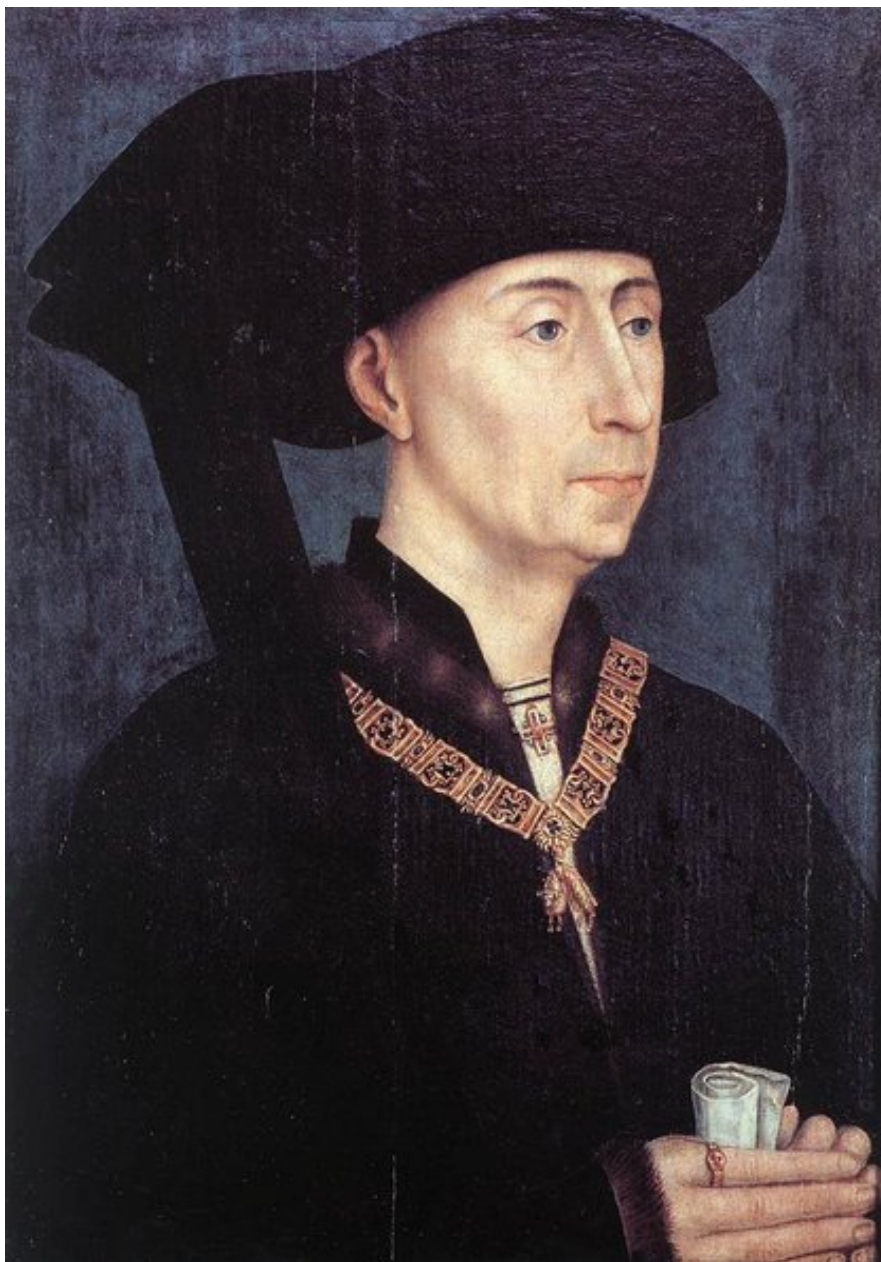
Figura 5 - Retrato de Felipe, O Bom (Ateliê de Roger Van der Weyden). Óleo sobre tela. C. 1460. Gemaldegalerie, Berlim. O preto fechado tornou-se símbolo da corte borgonhesa e difundiu-se na Espanha dos Habsburgos, onde se tornou um dos atributos do rei. No pescoço, a insígnia de rei da ordem do Tosão de Ouro, fundada por Felipe em 1430.