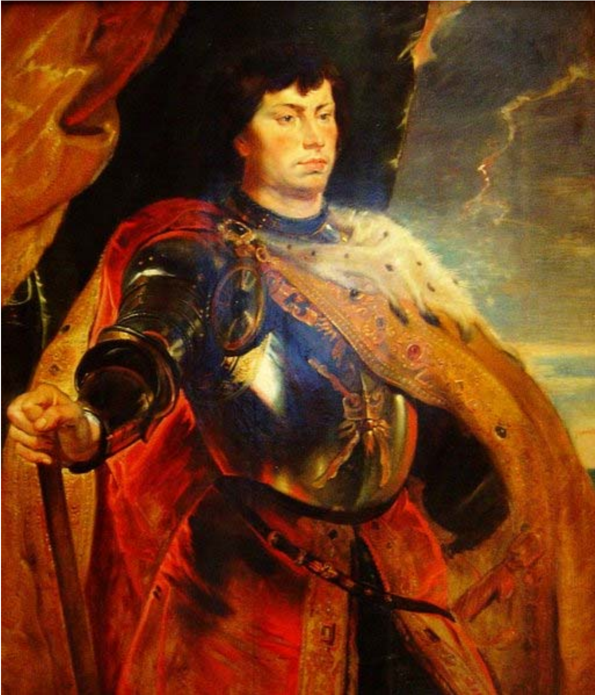
Figura 7 – Retrato de Carlos da Borgonha (Peter Paul Rubens) Óleo sobre tela. c. 1618. Kunsthistorisches Museum, Viena. Eis o retrato quimérico de Carlos, visto pelo século XVII. A ordem do Tosão está presente, mas muito mais discreta do que no retrato pintado por Van der Weyden. Aqui o “Temerário” aparece não no sóbrio vestuário negro, mas em trajes de batalha, de armadura e manto. A visão belicosa do último duque da Borgonha fixou-se no imaginário ocidental, até a revisão historiográfica do século XX. O pintor flamengo serviu a diversas cortes, como a espanhola, inglesa e francesa, mas é apontado como tendo um grande sentimento em relação à Flandres e a sua ligação com a casa Habsburgo.