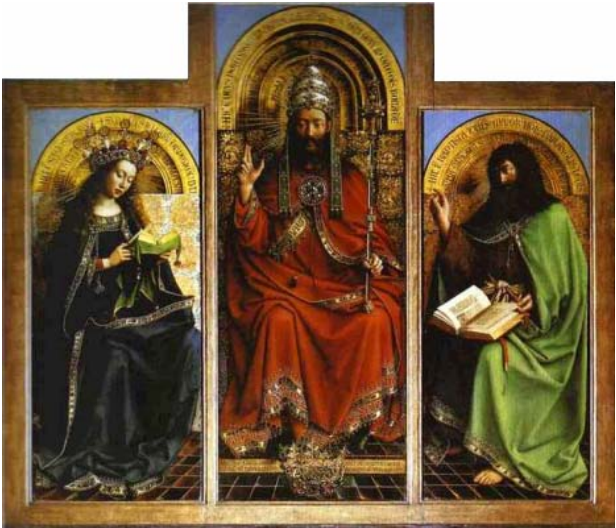
Figura 4: Retábulo do Cordeiro: Deus Pai, a Virgem, o Batista (1420-1432). Óleo sobre painéis de madeira. Catedral de São Bavão, Gand.