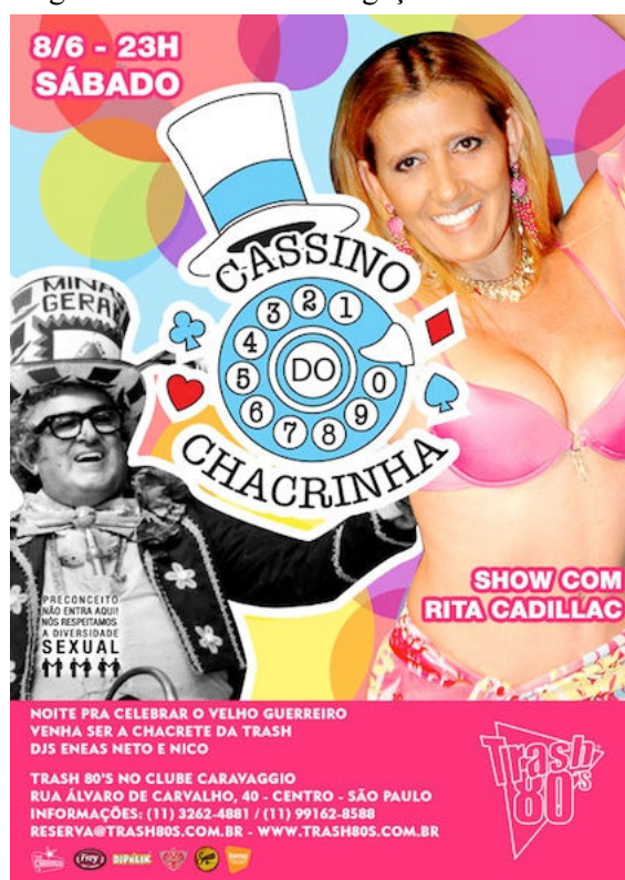
Figura 3 – Cartaz de divulgação da Trash 80's

O apresentador Chacrinha era uma das personalidades mais cultuadas. Seu programa de auditório, O Cassino do Chacrinha (figura 3), exibido na TV Globo entre 1982 e 1988, funcionava como uma espécie de parada de sucessos, onde se apresentavam os artistas de maior êxito comercial no momento.