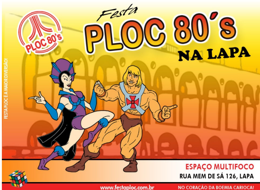
Figura 4 – Material de divulgação da Ploc 80's